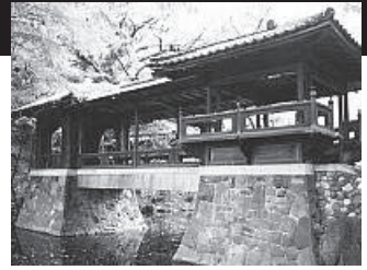
(揚輝荘北庭園 白雲橋)

千種区の隠れた名所、日泰寺の隣に位置する“揚輝荘”を前回の楢山サマセミに引き続きお借りします。子どもから大人までが楽しめる企画を準備してお待ちしています